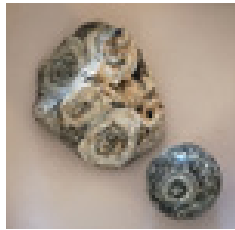
Echantillon diorite orbiculaire (corsite) (inv.93.24.14)