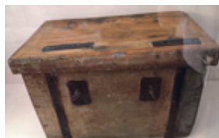
Cascia di cunfraternita